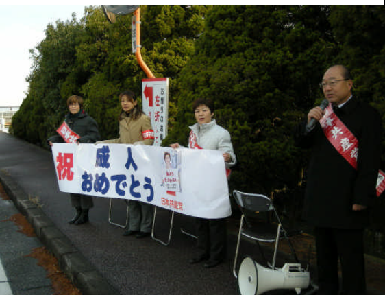
1 / 12 会場前宣伝の日本共産党滋賀県議団・市会議員団のようす

成人式会場の大津プリンスホテル前で『成人おめでとう！』若者が希望・夢をもって学び働くことが出来る社会ををめざして、共に力を合わせましようと呼びかけました。