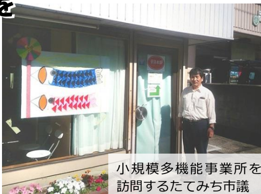
小規模多機能事業所を訪問するたてみち市議

するとしていますが、先行して実施した他の自治体では、必要なサービスが受けられず重度化したとの報告もあります。生活を支えるサービスの水準を引き下げることなく、誰もが安心して介護を受けられる体制をつくるため、国・県にさ