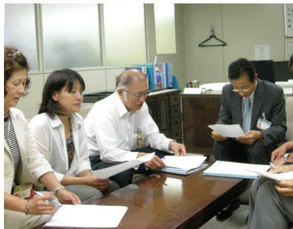
議員団と茂呂健康保険部長(右)↑ 申し入れする