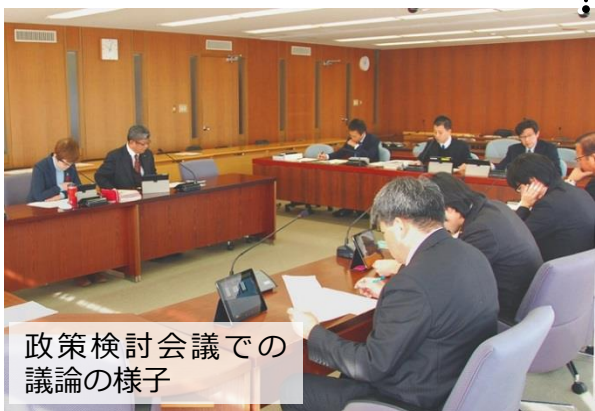
政策検討会議での議論の様子

に関して議論を重ねてき、この2月通常会議に「(仮称)がん対策推進条例」を上程することになりました。